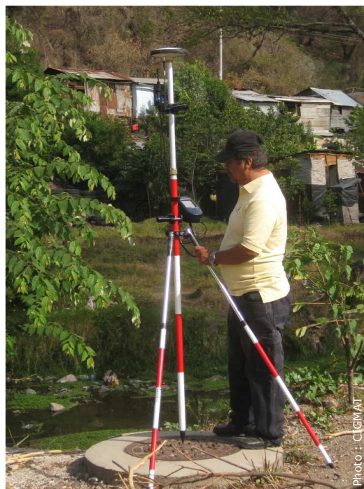
Un membre du CIGMAT participant aux relevés de la rivière (ici sur un regard d'égout servant de point de repère topographique).

Chaleureuses salutations à toutes et tous !